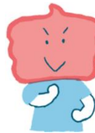
(ショルダー兄さん)